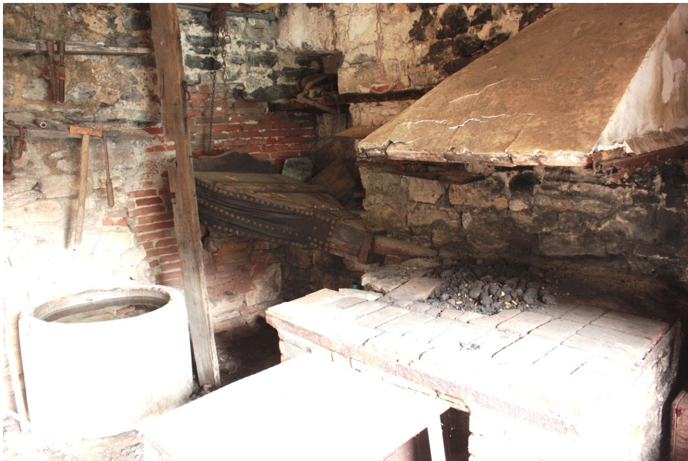
La Forge de Brengues